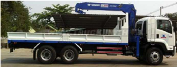
รถติดเครน / เอี้ยบ