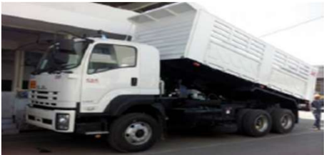
รถดั้มพ์ / รถคอกสูง